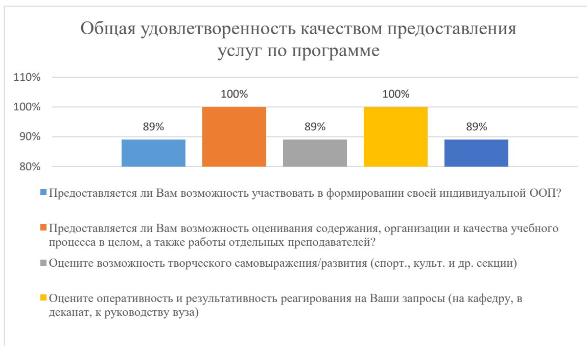
Диаграмма 2.4.5. Общая удовлетворенность качеством предоставления услуг по программе

Общий вывод Общая удовлетворенность качеством предоставления образовательных услуг по программе — 93%: полная удовлетворенность.