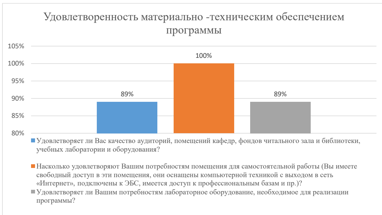
Диаграмма 2.4.4. Удовлетворенность материально-техническим обеспечением

Общий вывод - Удовлетворенность материально-техническим обеспечением программы — 93%: полная удовлетворенность.