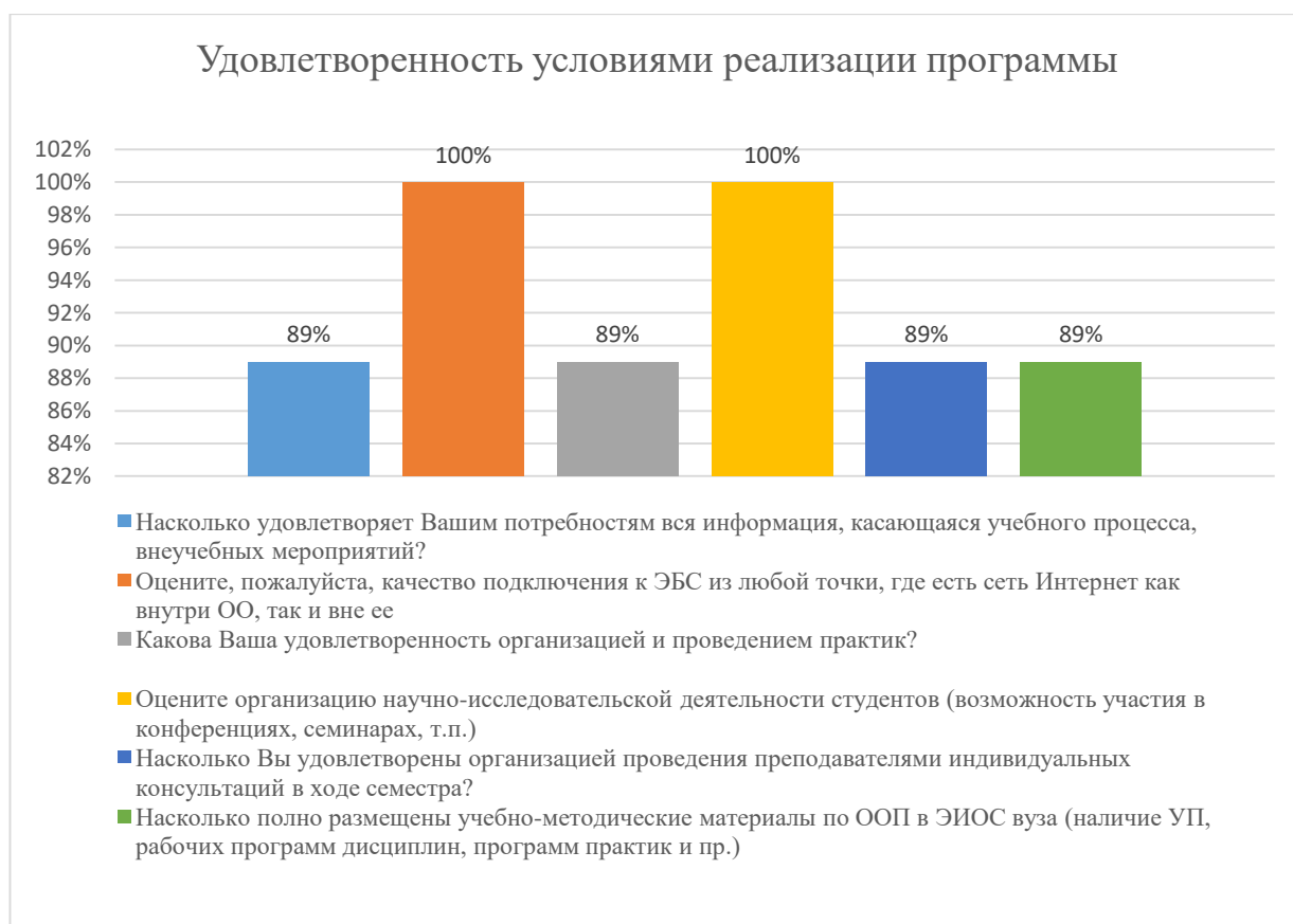
Диаграмма 2.4.3. Удовлетворенность условиями реализации программы

Общий вывод - Удовлетворенность условиями реализации программы — 93%: полная удовлетворенность.