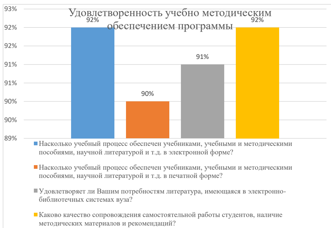
Диаграмма 2.4.2 Удовлетворенность учебно-методическим обеспечением программы

Общий вывод - Удовлетворенность учебно-методическим обеспечением программы — 91%: полная удовлетворенность.