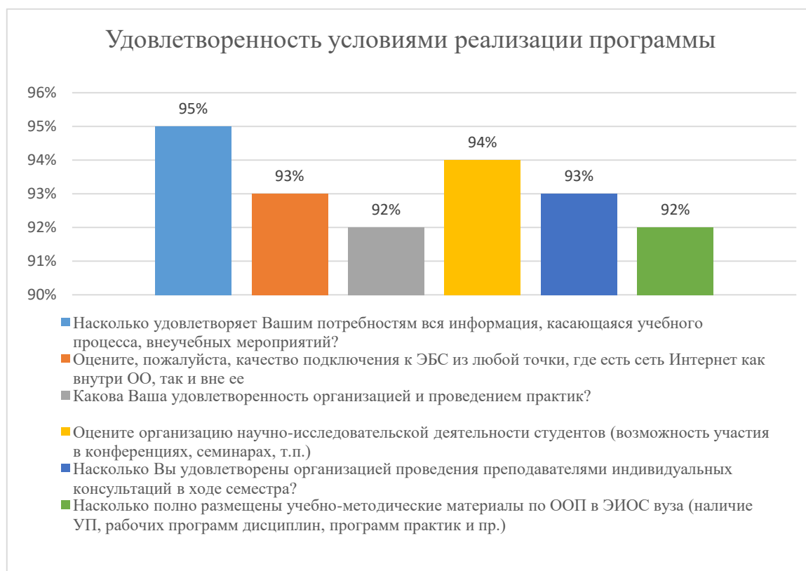
Диаграмма 2.4.3. Удовлетворенность условиями реализации программы