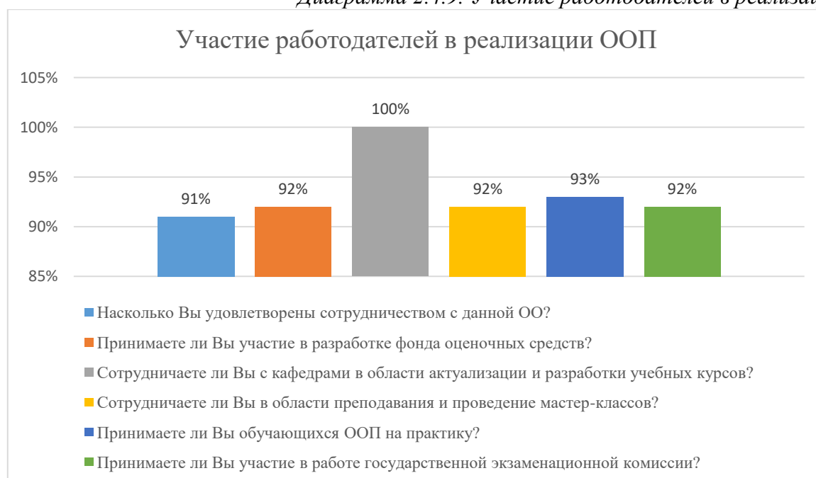
Диаграмма 2.4.9. Участие работодателей в реализации ООП