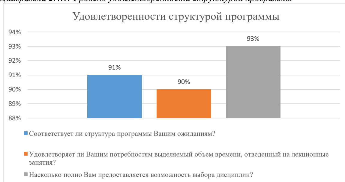
Диаграмма 2.4.1. Уровень удовлетворенности структурой программы

Общий вывод - Удовлетворенность структурой программы — 91%: полная удовлетворенность