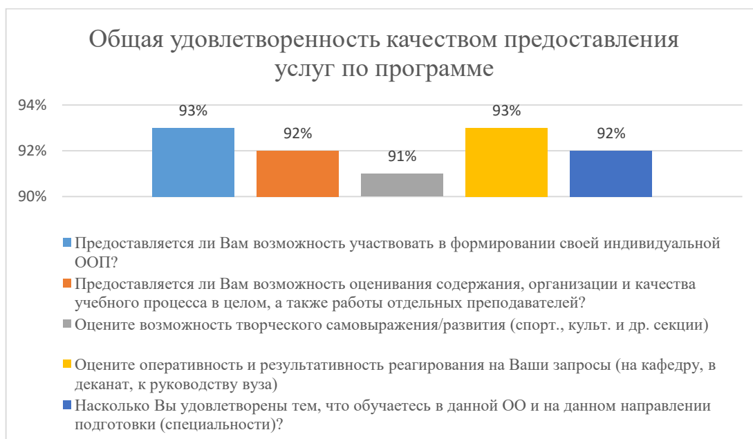
Диаграмма 2.4.5. Общая удовлетворенность качеством предоставления услуг по программе

Общий вывод Общая удовлетворенность качеством предоставления образовательных услуг по программе — 92%: полная удовлетворенность.