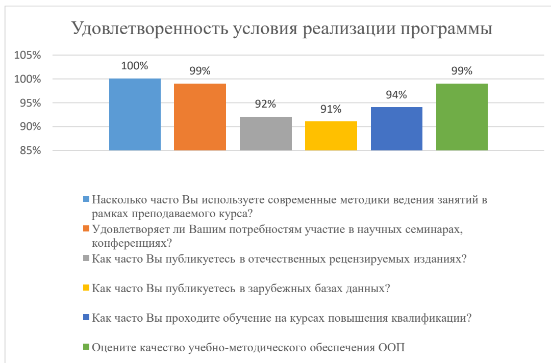
Диаграмма 2.4.6. Удовлетворенность условиями реализации программы

Общий вывод- Удовлетворенность условиями реализации программы – 96%: полная удовлетворенность.