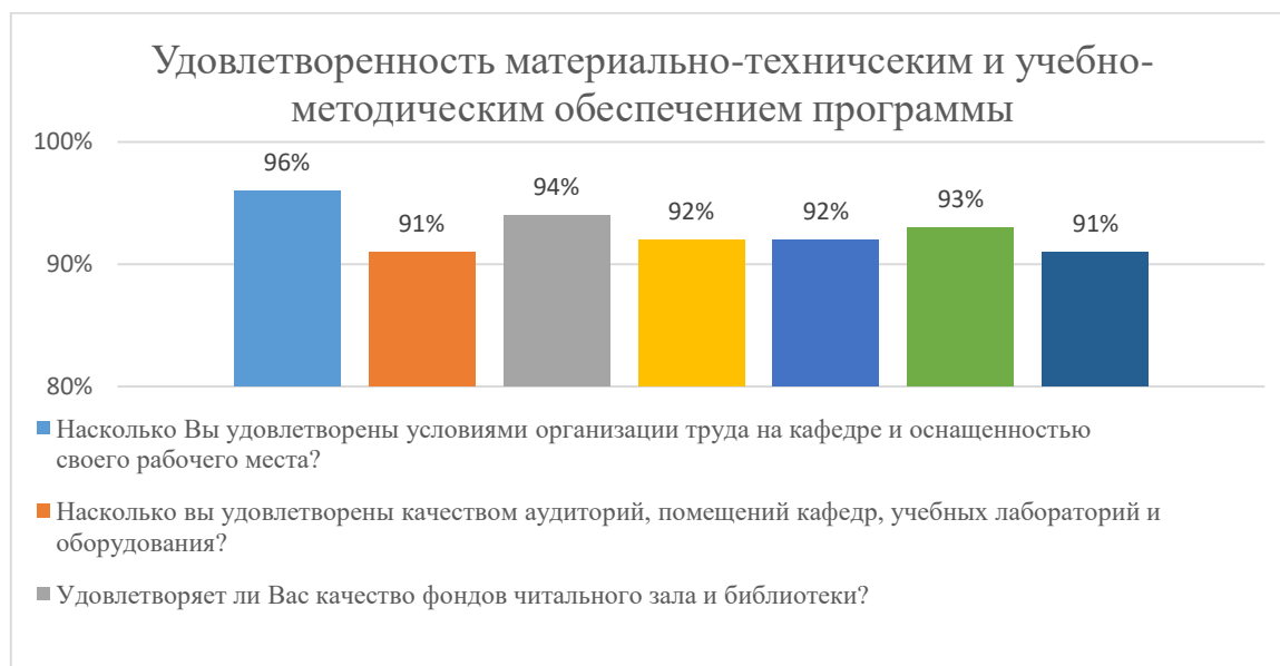
Диаграмма 2.4.7. Удовлетворенность материально-техническим и учебно-методическим обеспечением программы

Общий вывод- Удовлетворенность материально-техническим и учебно-методическим обеспечением программы – 93%: полная удовлетворенность.