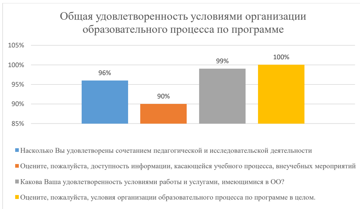
Диаграмма 2.4.8. Общая удовлетворенность условиями организации образовательного процесса по программе

Общий вывод- Общая удовлетворенность условиями организации образовательного процесса по программе - 96%: полная удовлетворенность.