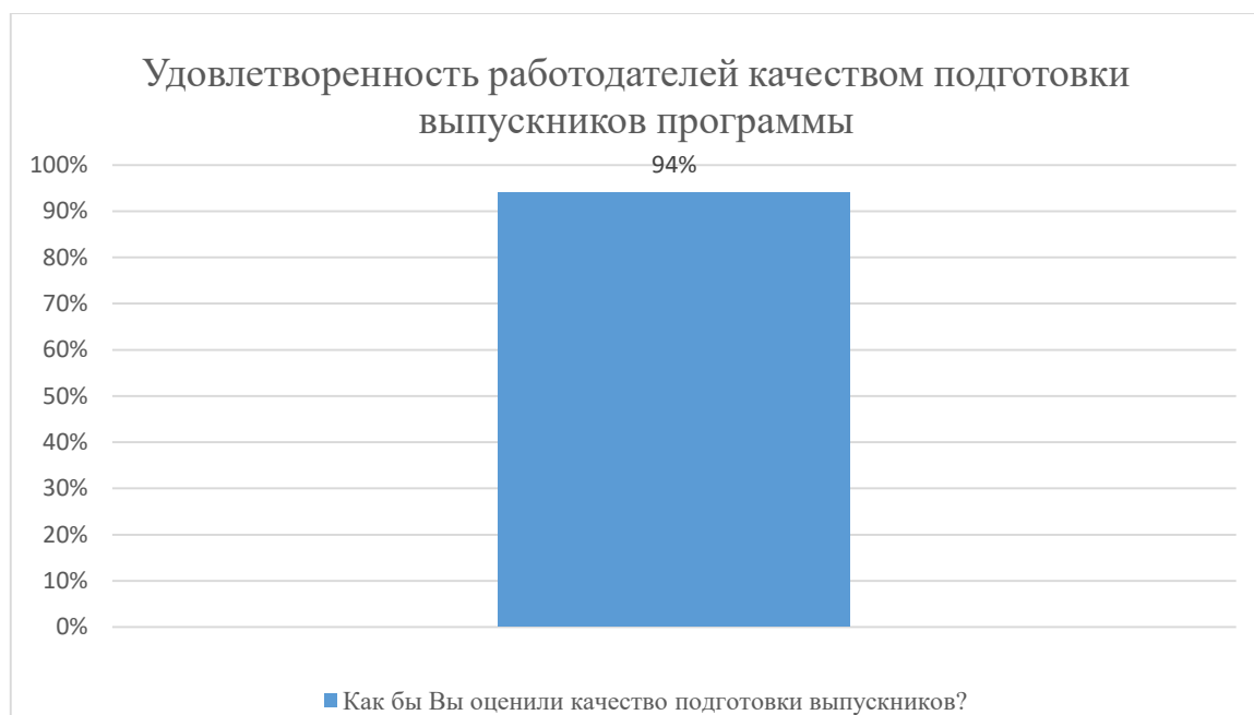
Диаграмма 2.4.11. Удовлетворённость работодателей качеством подготовки выпускников программы

Общий вывод- Общая удовлетворенность условиями организации образовательного процесса по программе -94%: полная удовлетворенность.