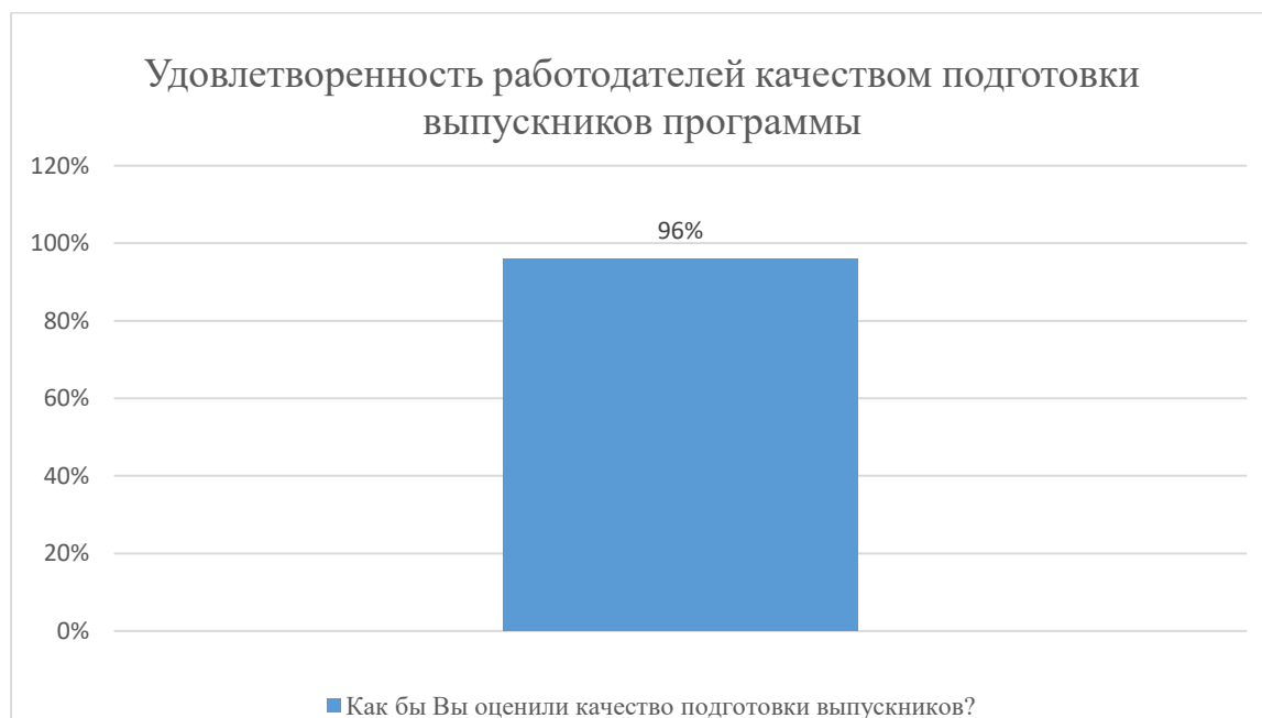
Диаграмма 2.4.11. Удовлетворённость работодателей качеством подготовки выпускников программы

Общий вывод- Общая удовлетворенность условиями организации образовательного процесса по программе -96 %: полная удовлетворенность.