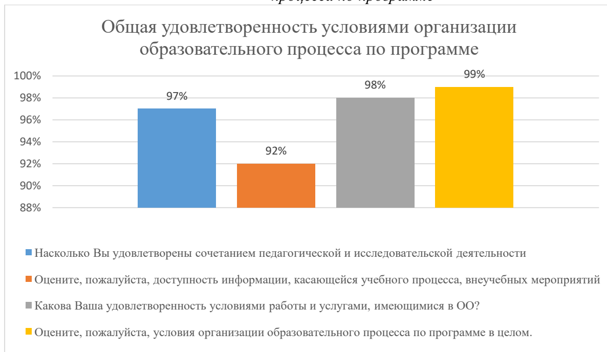
Диаграмма 2.4.8. Общая удовлетворенность условиями организации образовательного процесса по программе

Общий вывод- Общая удовлетворенность условиями организации образовательного процесса по программе – 96,5 %: полная удовлетворенность.