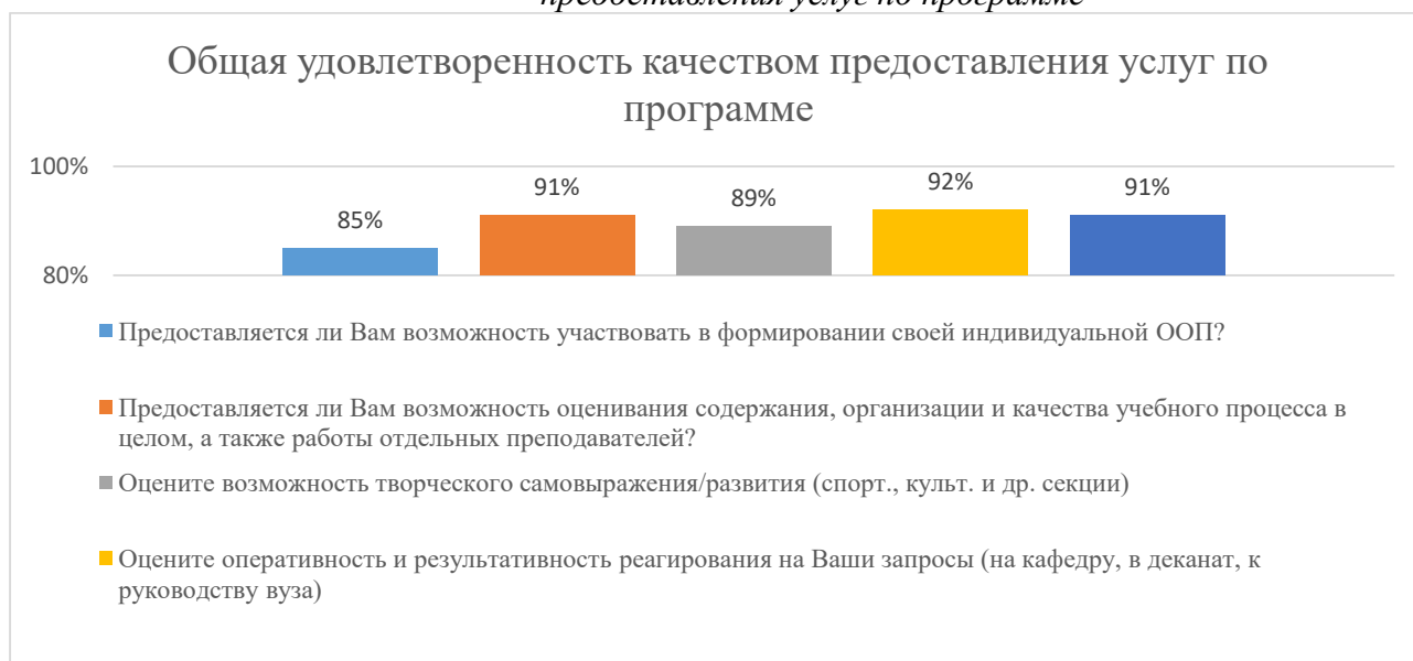
Пятый блок вопросов анкеты Диаграмма 2.4.5. Общая удовлетворенность качеством предоставления услуг по программе

Общий вывод Общая удовлетворенность качеством предоставления образовательных услуг по программе — 89,6 %: полная удовлетворенность.