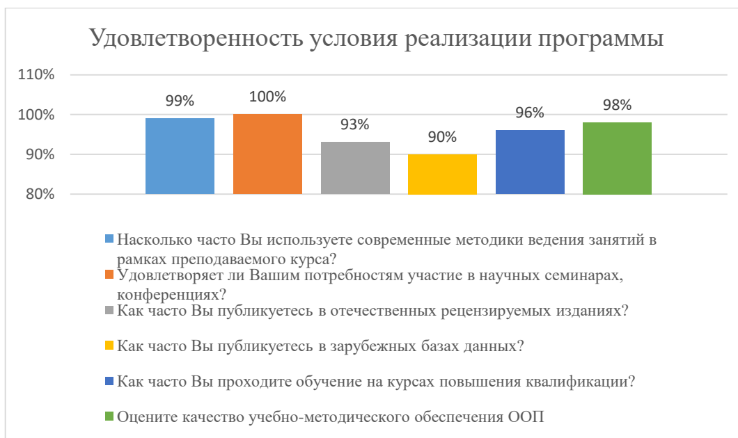
Диаграмма 2.4.6. Удовлетворенность условиями реализации программы