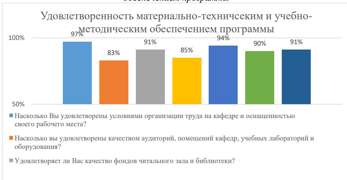
Диаграмма 2.4.7. Удовлетворенность материально-техническим и учебно-методическим обеспечением программы

Общий вывод- Удовлетворенность материально-техническим и учебно-методическим обеспечением программы – 90 %: полная удовлетворенность.