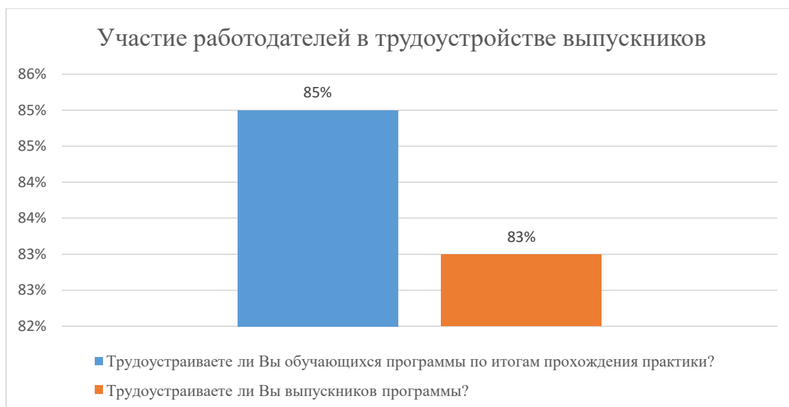
Диаграмма 2.4.10. Участие работодателей в трудоустройстве выпускников

Общий вывод- Общая удовлетворенность условиями организации образовательного процесса по программе – 84 %: полная удовлетворенность.