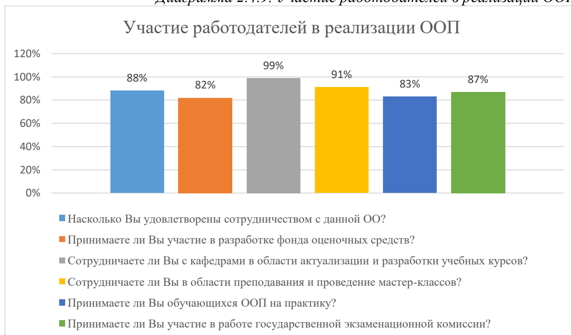
Диаграмма 2.4.9. Участие работодателей в реализации ООП

Общий вывод- Общая удовлетворенность условиями организации образовательного процесса по программе – 88,3 %: полная удовлетворенность.