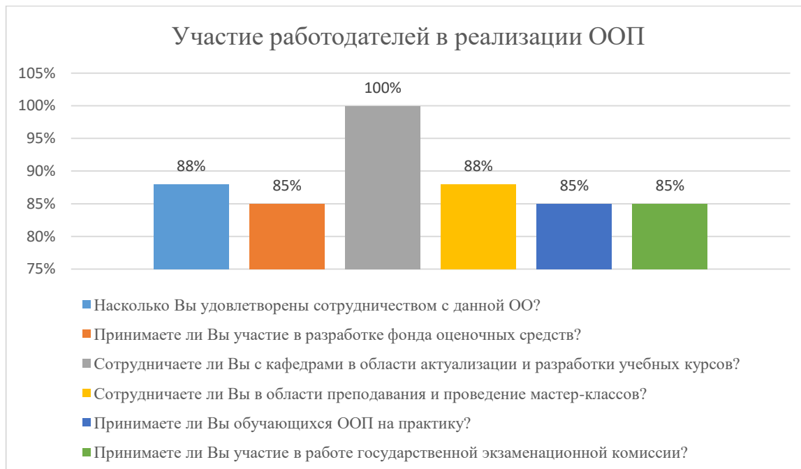
Диаграмма 2.4.9. Участие работодателей в реализации ООП

Общий вывод- Общая удовлетворенность условиями организации образовательного процесса по программе – 88,5%: полная удовлетворенность.