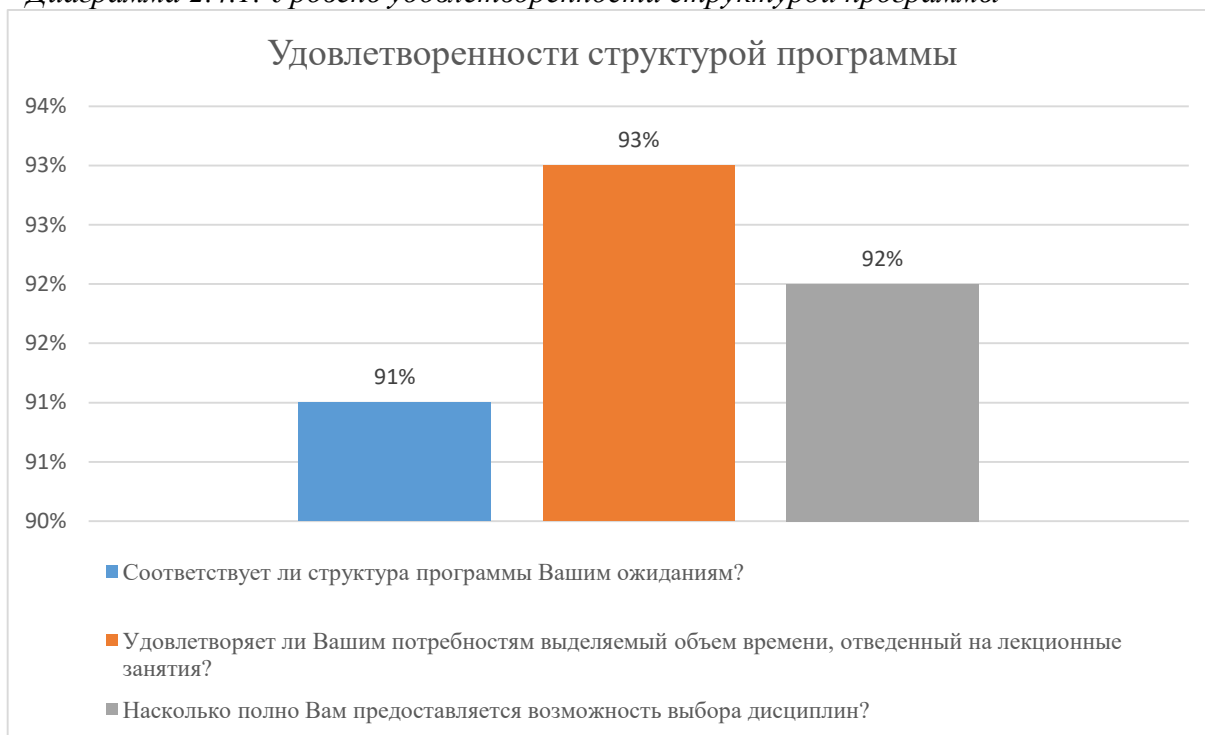
Диаграмма 2.4.1. Уровень удовлетворенности структурой программы

Общий вывод - Удовлетворенность структурой программы — 92%: полная удовлетворенность