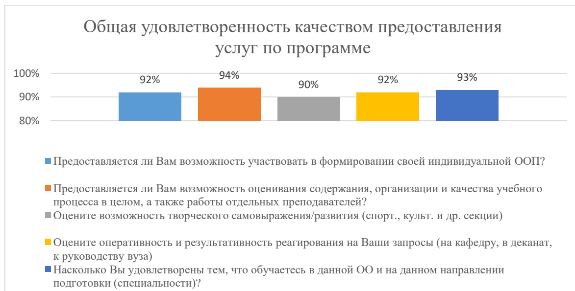
Диаграмма 2.4.5. Общая удовлетворенность качеством предоставления услуг по программе

Общий вывод Общая удовлетворенность качеством предоставления образовательных услуг по программе — 92%: полная удовлетворенность.