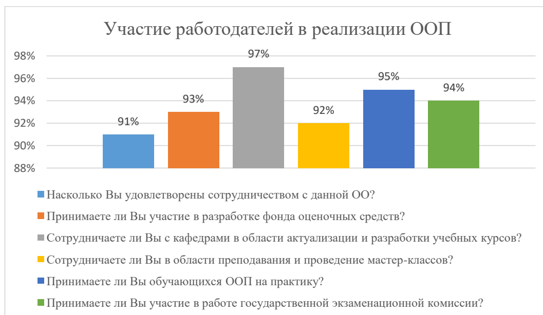
Диаграмма 2.4.9. Участие работодателей в реализации ООП