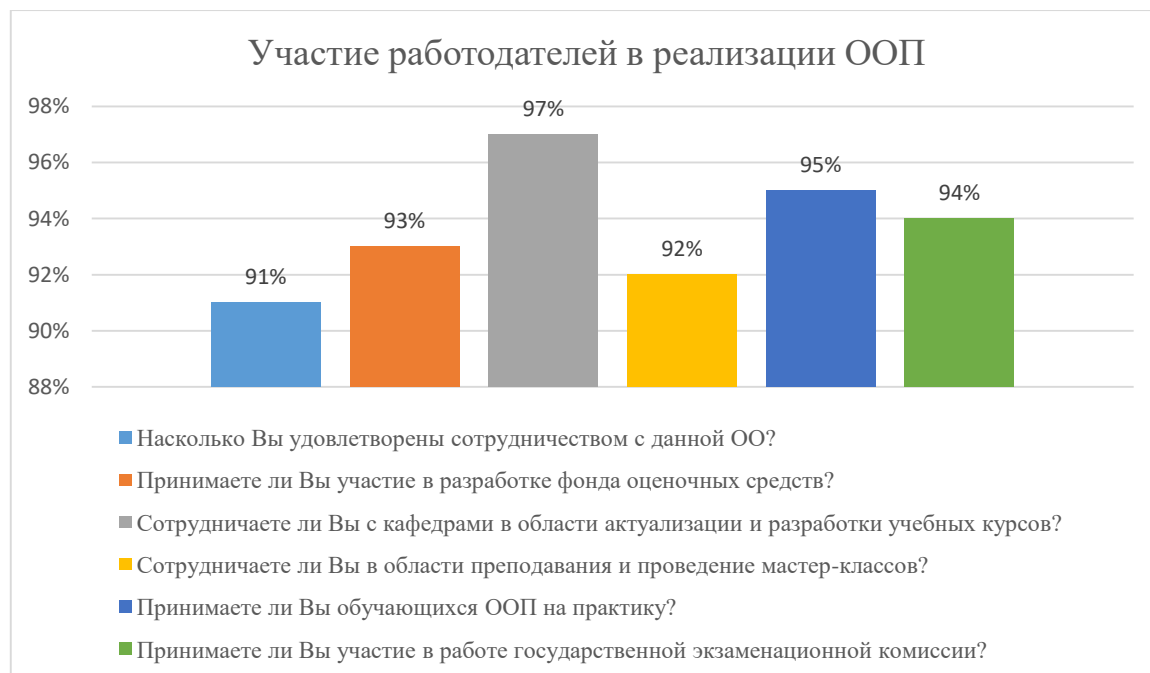
Диаграмма 2.4.9. Участие работодателей в реализации ООП

Общий вывод- Общая удовлетворенность условиями организации образовательного процесса по программе – 94%: полная удовлетворенность.