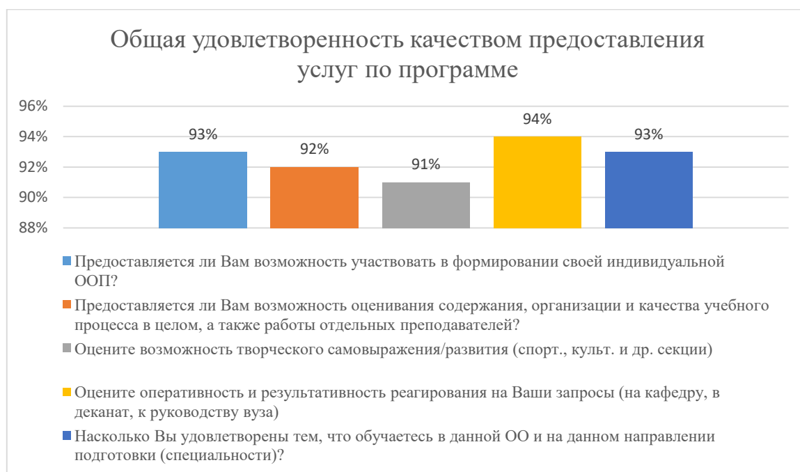
Диаграмма 2.4.5. Общая удовлетворенность качеством предоставления услуг по программе

Общий вывод Общая удовлетворенность качеством предоставления образовательных услуг по программе — 93%: полная удовлетворенность.