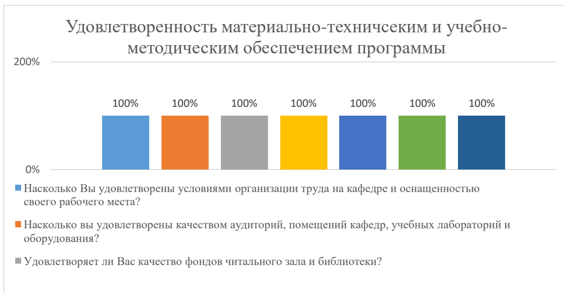
Диаграмма 2.4.7. Удовлетворенность материально-техническим и учебно-методическим обеспечением программы

Общий вывод - Удовлетворенность материально-техническим и учебно-методическим обеспечением программы – 100%: полная удовлетворенность.