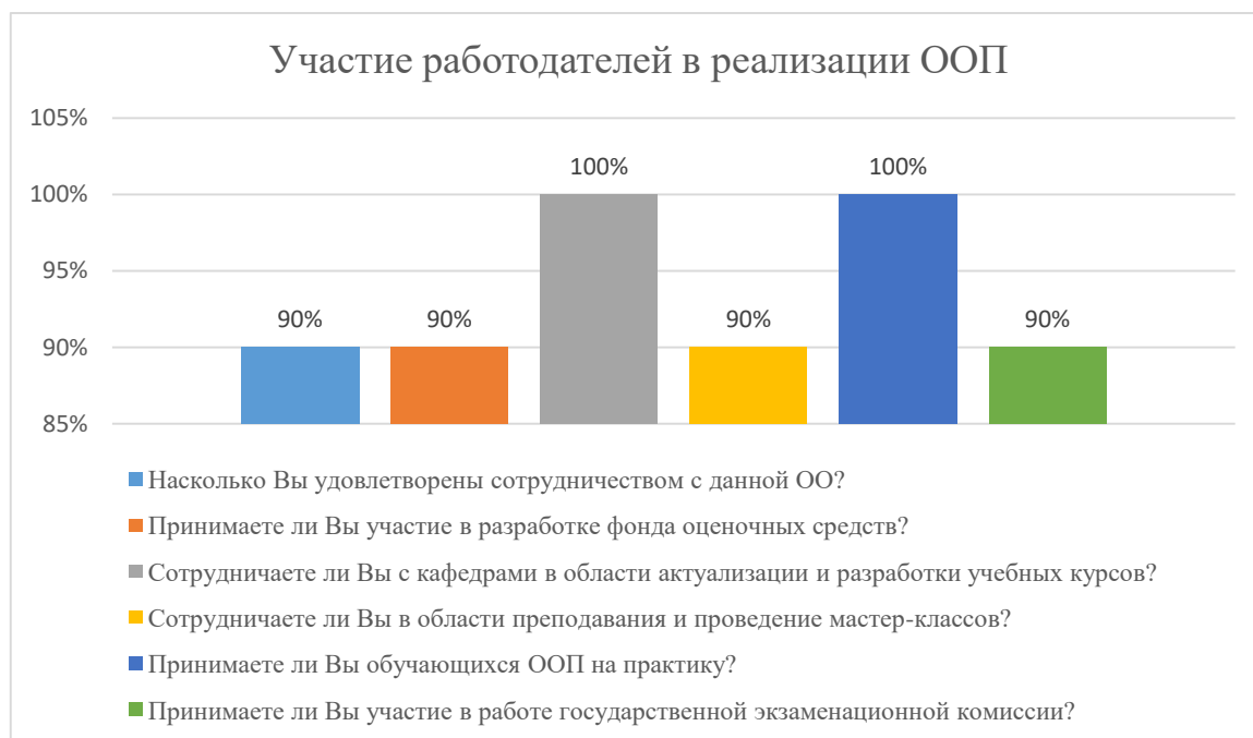
Диаграмма 2.4.9. Участие работодателей в реализации ООП

Общий вывод- Общая удовлетворенность условиями организации образовательного процесса по программе – 93%: полная удовлетворенность.