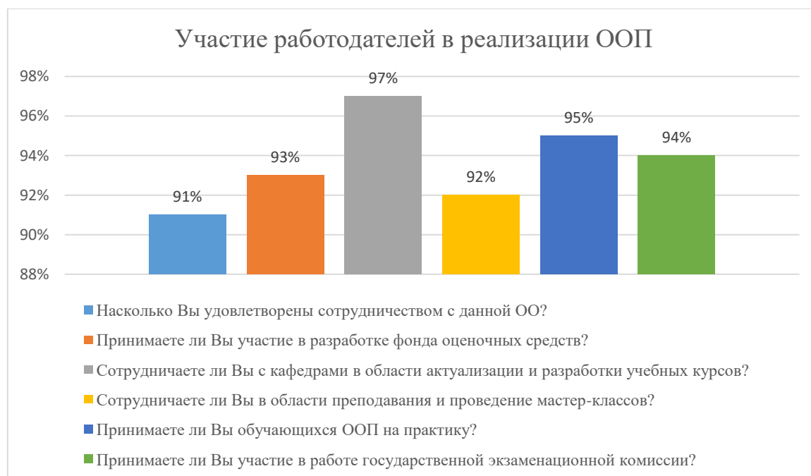
Диаграмма 2.4.9. Участие работодателей в реализации ООП

Общий вывод- Общая удовлетворенность условиями организации образовательного процесса по программе – 94%: полная удовлетворенность.