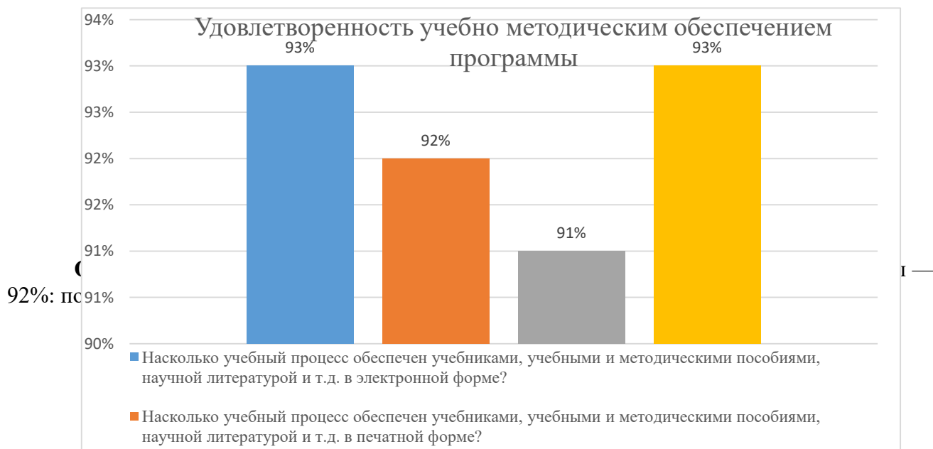
Диаграмма 2.4.2 Удовлетворенность учебно-методическим обеспечением программы