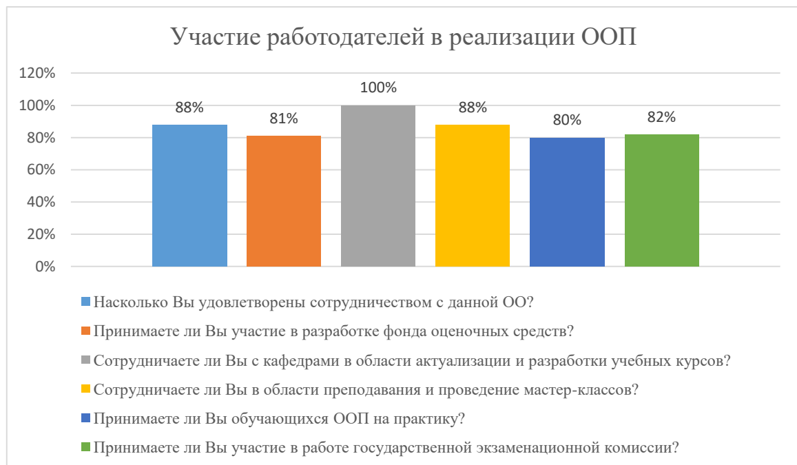
Диаграмма 2.4.9. Участие работодателей в реализации ООП

Общий вывод- Общая удовлетворенность условиями организации образовательного процесса по программе – 86,5%: полная удовлетворенность.