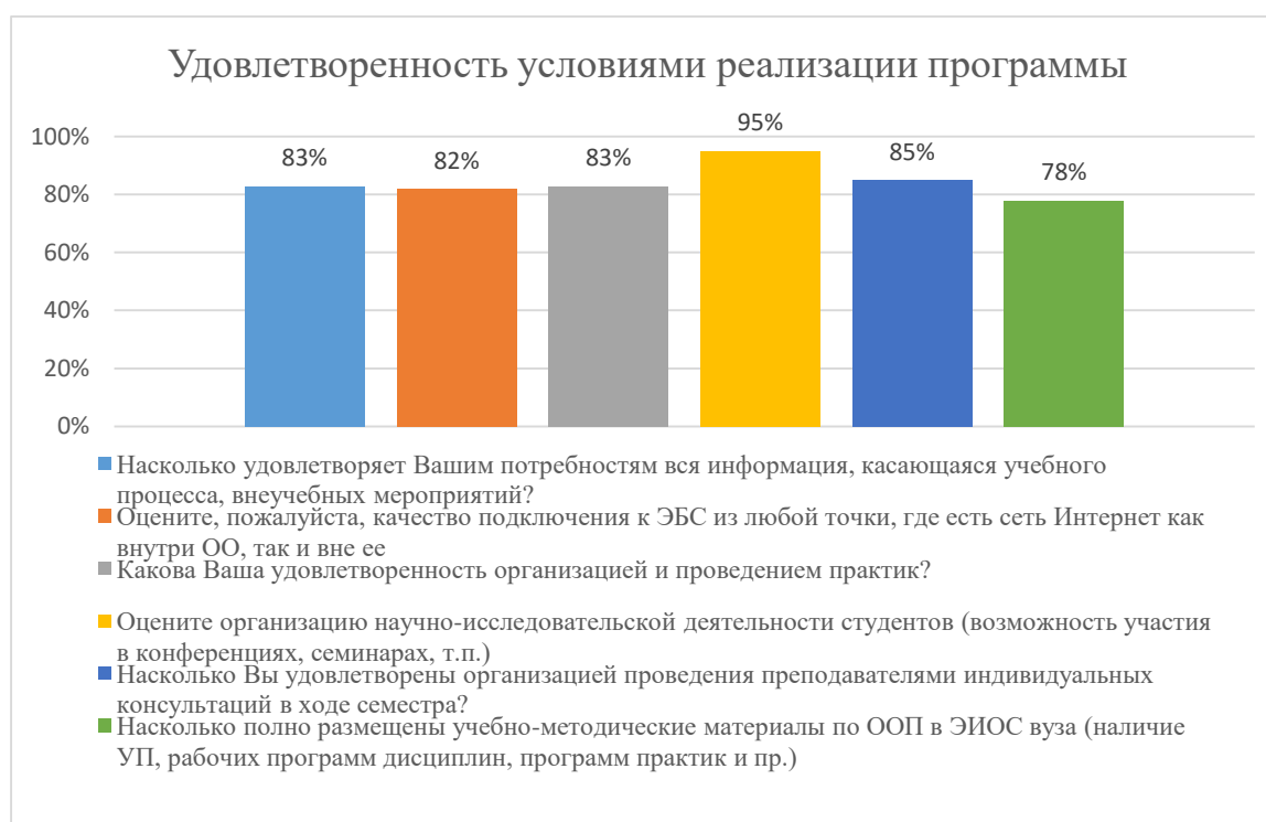
Диаграмма 2.4.3. Удовлетворенность условиями реализации программы

Общий вывод - Удовлетворенность условиями реализации программы — 84,3 %: полная удовлетворенность.