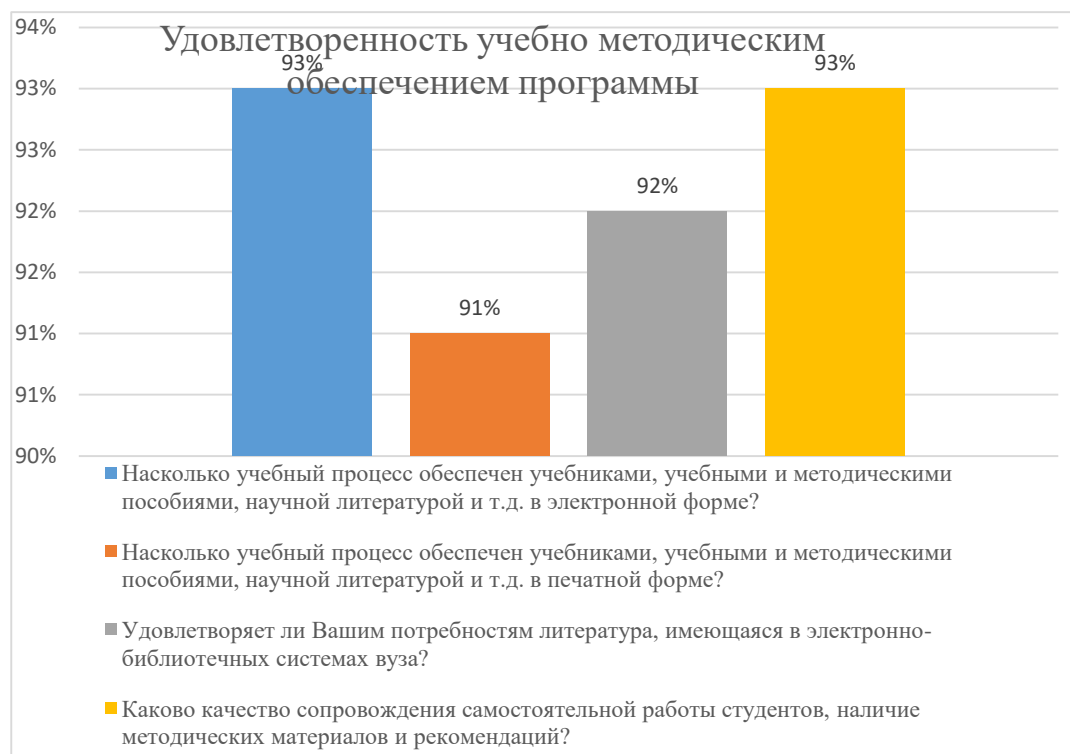
Диаграмма 2.4.2 Удовлетворенность учебно-методическим обеспечением программы

Общий вывод - Удовлетворенность учебно-методическим обеспечением программы — 92%: полная удовлетворенность.