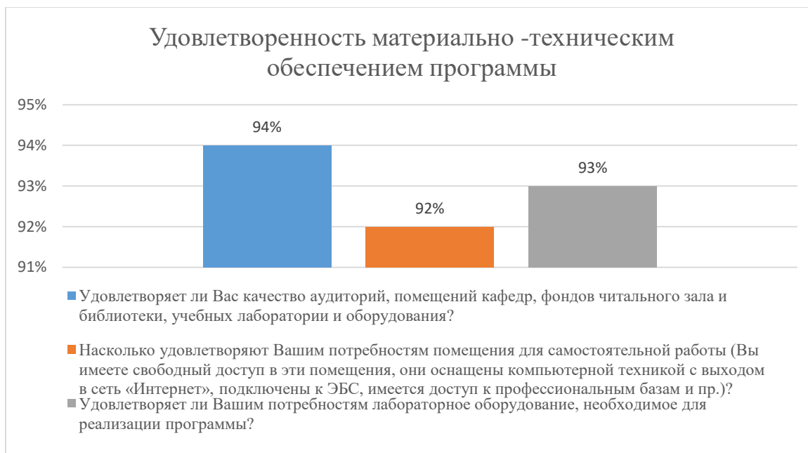
Диаграмма 2.4.4. Удовлетворенность материально-техническим обеспечением

Общий вывод - Удовлетворенность материально-техническим обеспечением программы — 93%: полная удовлетворенность.