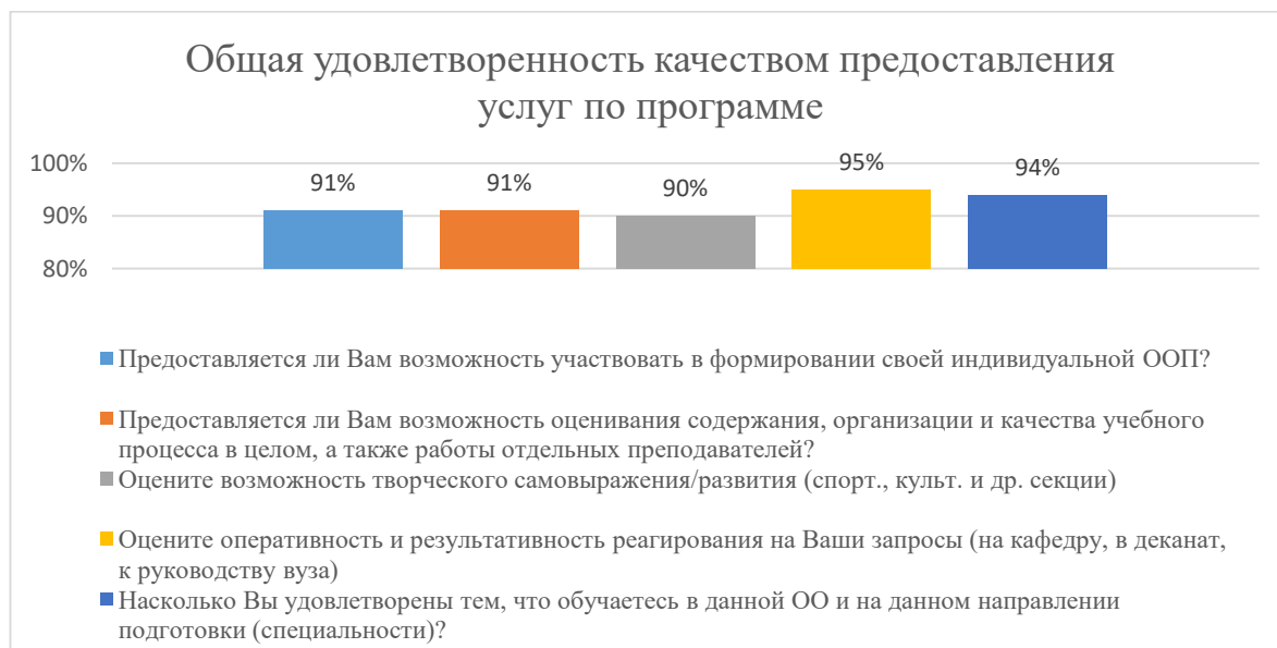
Диаграмма 2.4.5. Общая удовлетворенность качеством предоставления услуг по программе

Общий вывод Общая удовлетворенность качеством предоставления образовательных услуг по программе — 92%: полная удовлетворенность.