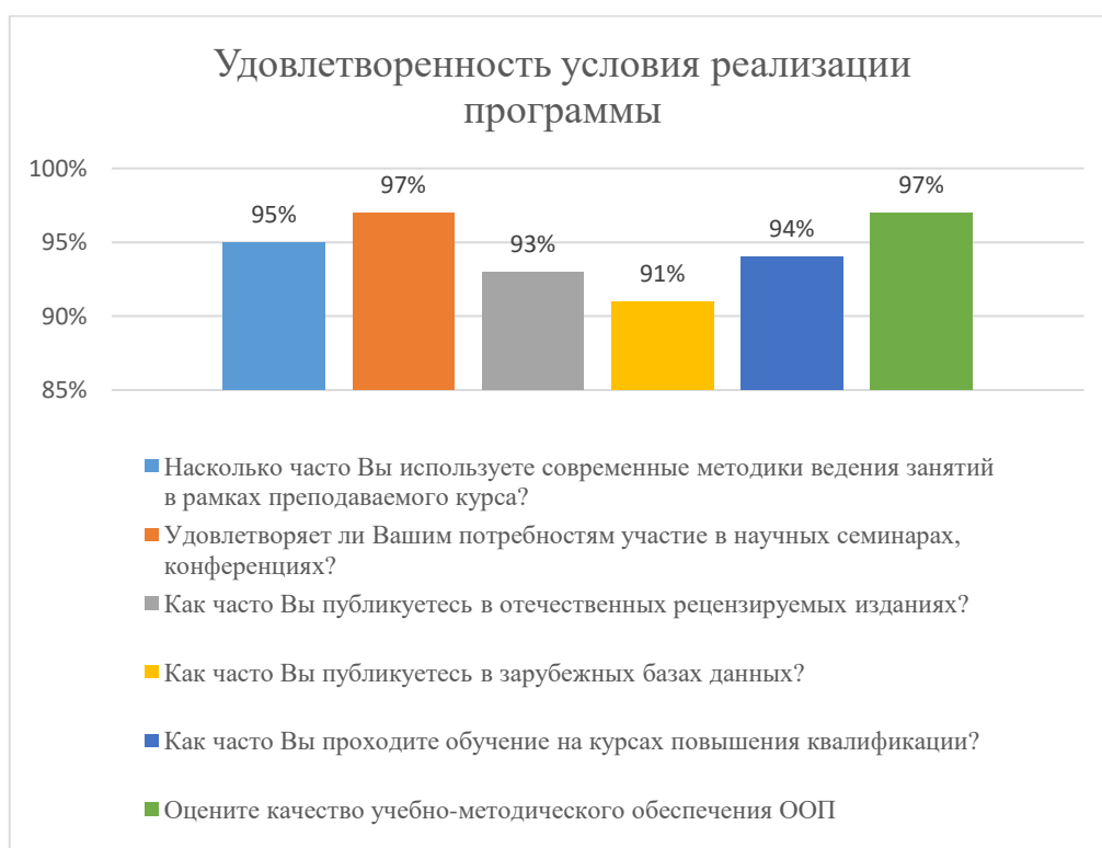
Диаграмма 2.4.6. Удовлетворенность условиями реализации программы