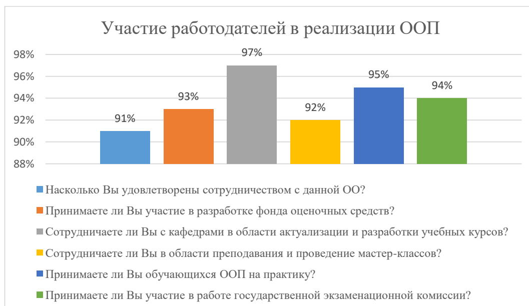
Диаграмма 2.4.9. Участие работодателей в реализации ООП