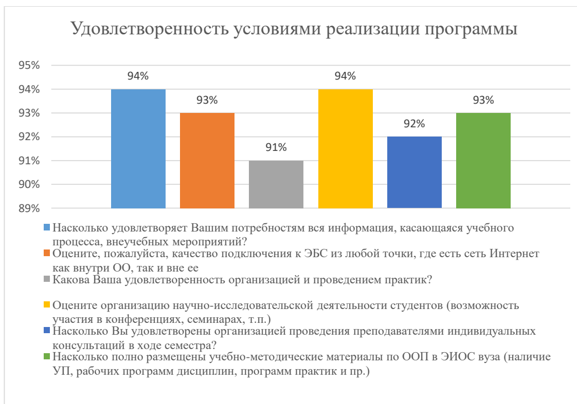
Диаграмма 2.4.3. Удовлетворенность условиями реализации программы