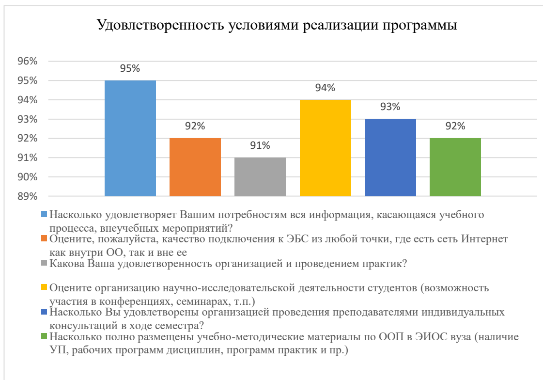
Диаграмма 2.4.3. Удовлетворенность условиями реализации программы