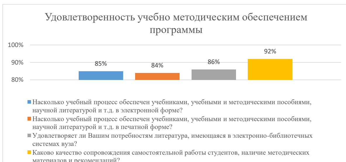
Диаграмма 2.4.2 Удовлетворенность учебно-методическим обеспечением программы

Общий вывод - Удовлетворенность учебно-методическим обеспечением программы — 86,75 %: полная удовлетворенность.