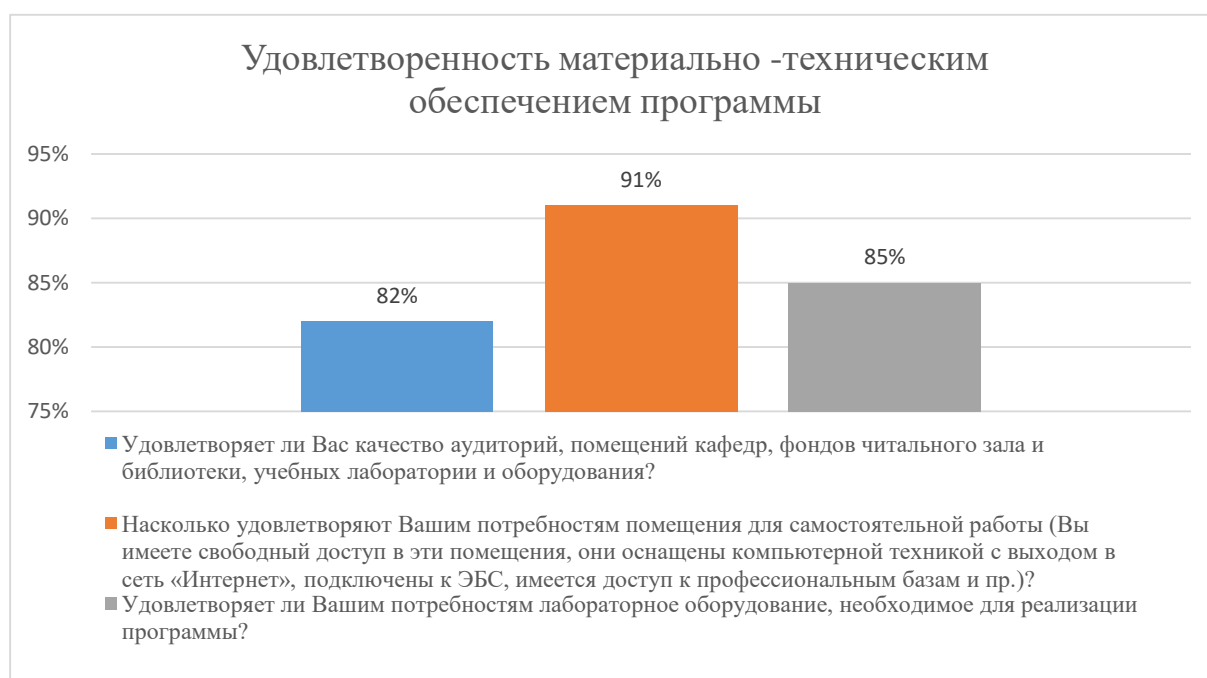
Диаграмма 2.4.4. Удовлетворенность материально-техническим обеспечением

Общий вывод - Удовлетворенность материально-техническим обеспечением программы — 86 %: полная удовлетворенность.