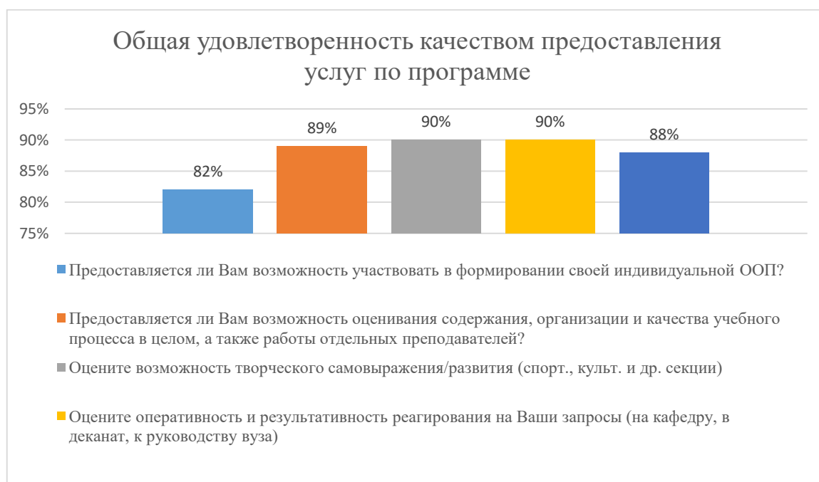
Диаграмма 2.4.5. Общая удовлетворенность качеством предоставления услуг по программе

Общий вывод Общая удовлетворенность качеством предоставления образовательных услуг по программе — 88%: полная удовлетворенность.