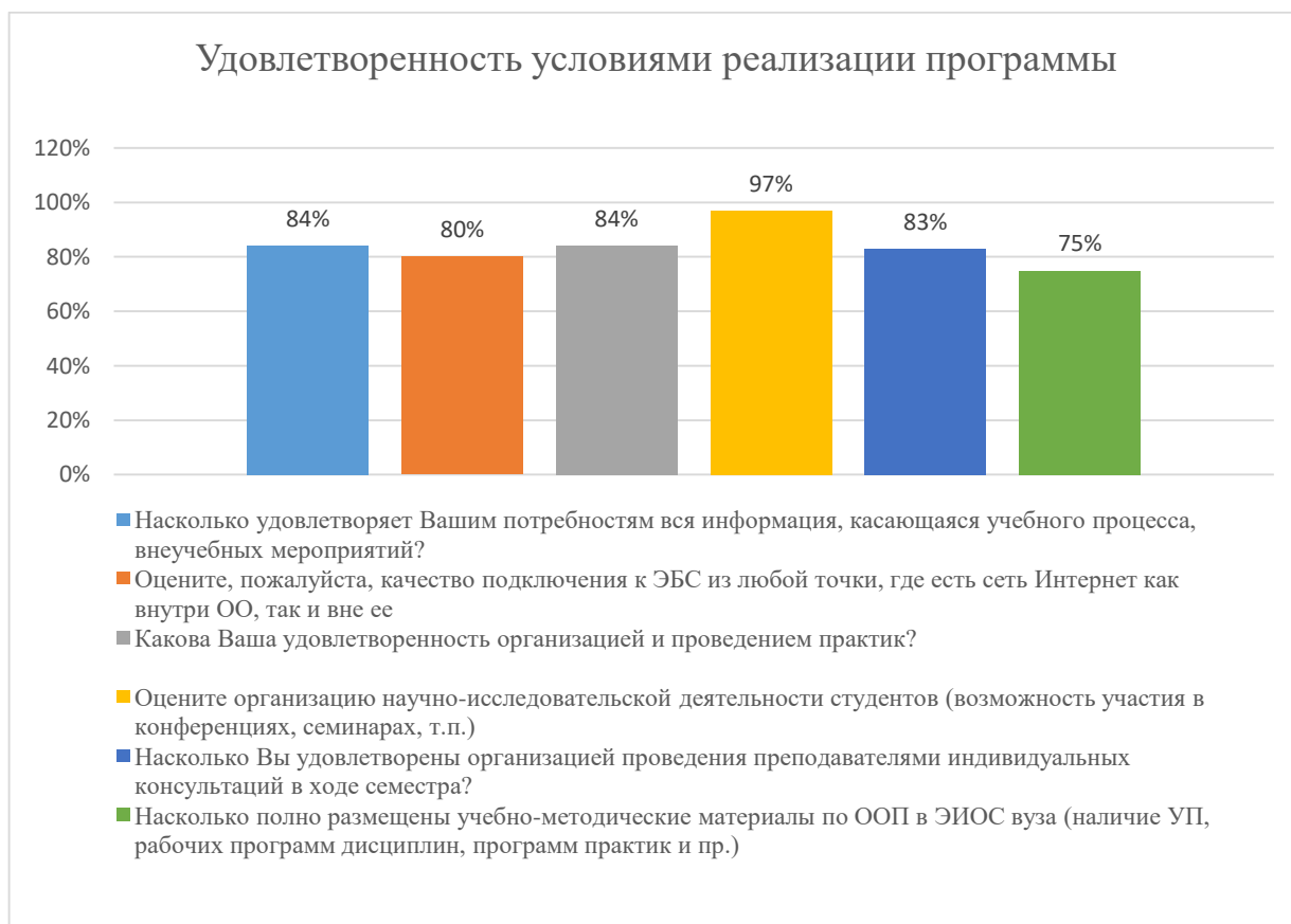
Диаграмма 2.4.3. Удовлетворенность условиями реализации программы

Общий вывод - Удовлетворенность условиями реализации программы — 84%: полная удовлетворенность.