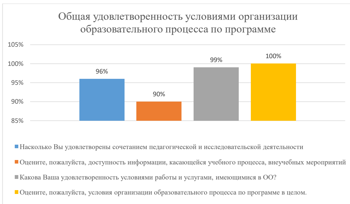
Диаграмма 2.4.8. Общая удовлетворенность условиями организации образовательного процесса по программе

Общий вывод- Общая удовлетворенность условиями организации образовательного процесса по программе - 96%: полная удовлетворенность.