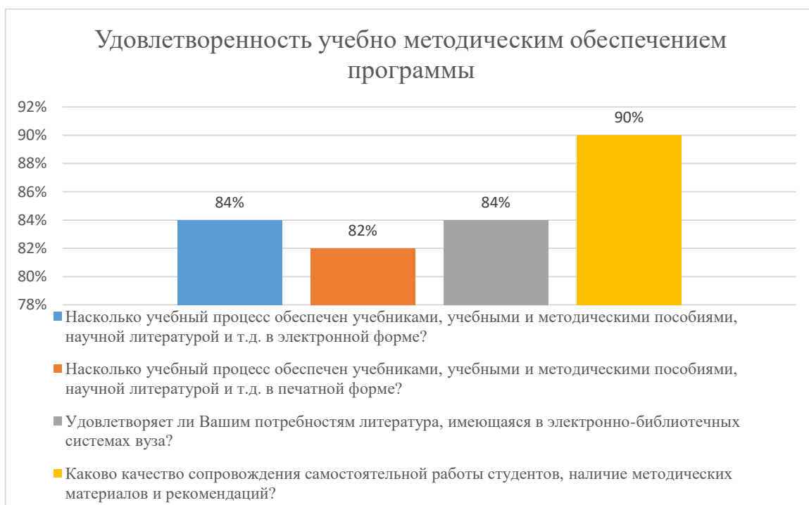
Диаграмма 2.4.2 Удовлетворенность учебно-методическим обеспечением программы

Общий вывод - Удовлетворенность учебно-методическим обеспечением программы — 85%: полная удовлетворенность.