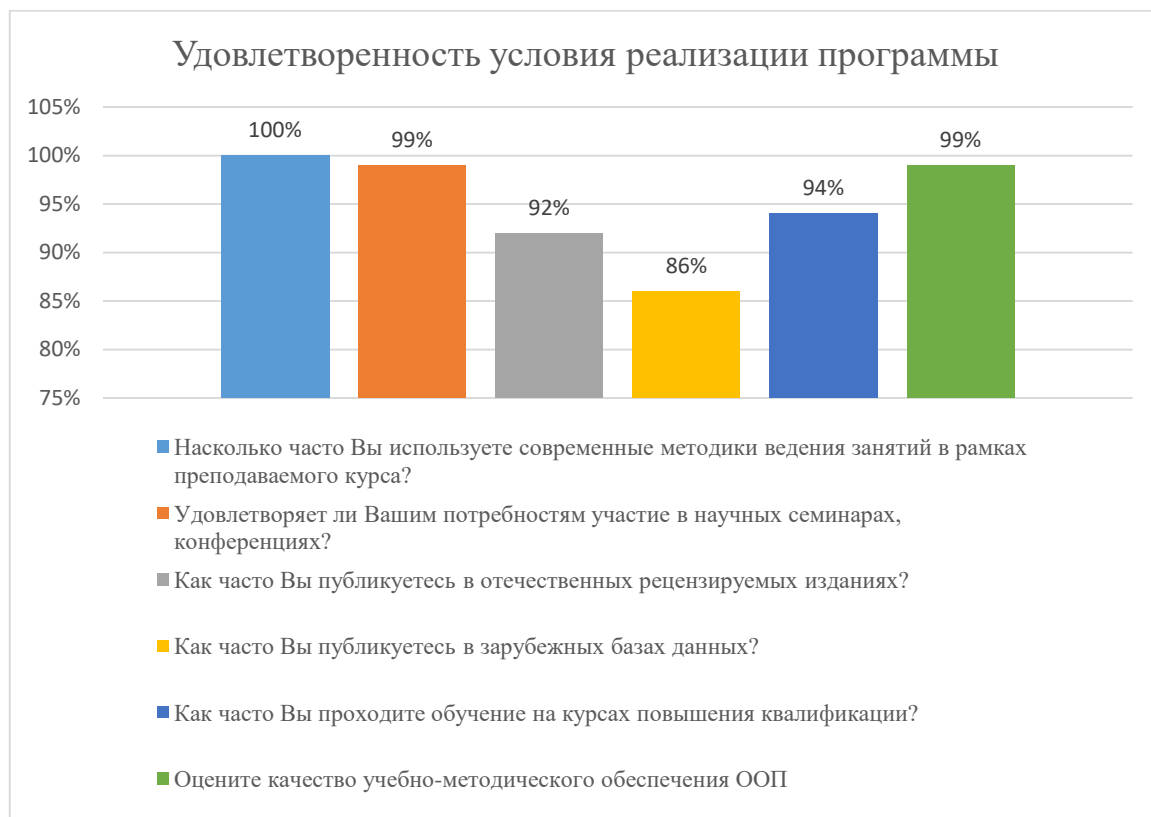
Диаграмма 2.4.6. Удовлетворенность условиями реализации программы

Общий вывод- Удовлетворенность условиями реализации программы – 94,6%: полная удовлетворенность.