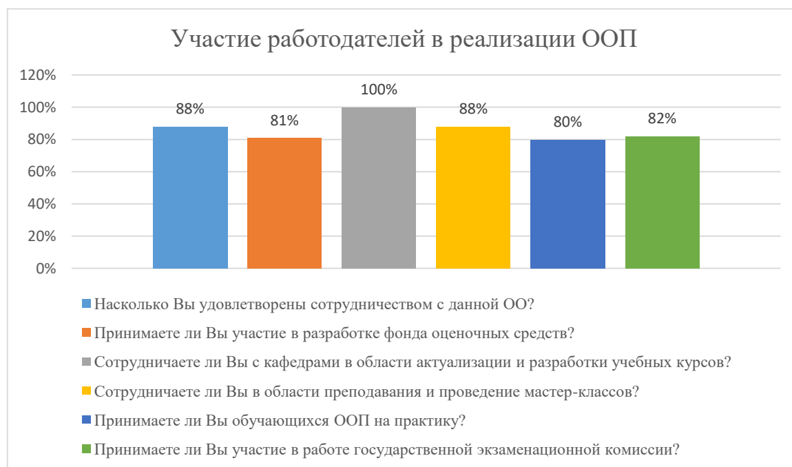
Диаграмма 2.4.9. Участие работодателей в реализации ООП

Общий вывод- Общая удовлетворенность условиями организации образовательного процесса по программе – 86,5%: полная удовлетворенность.