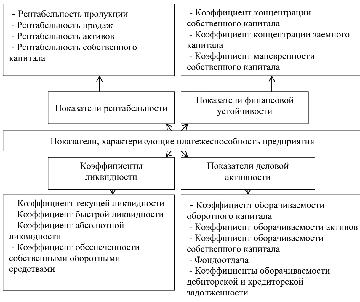
Рисунок 1 – Финансовые показатели платежеспособности предприятия

При построении графиков по осям координат вводятся соответствующие показатели, буквенные обозначения которых выносятся на концы координатных осей, фиксируемые стрелками.